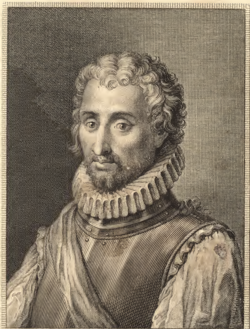
D. CHRISTOVAL COLON DESCUBRIDOR DEL NUEVO MUNDO.